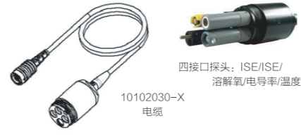
可供选配的电缆和四接口探头组合